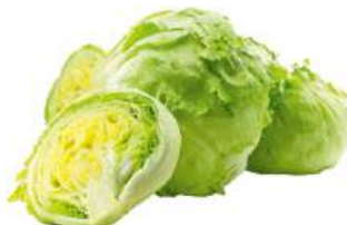
Салат Айсберг 1 кг, Иран