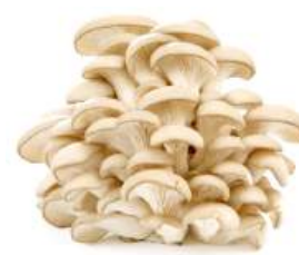
Грибы вешенки, 200 г Беларусь