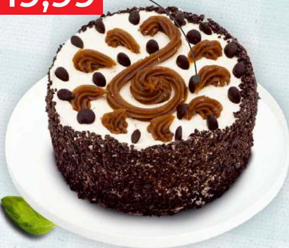
Булочка сметанно- маковая, 100 г