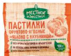
Пастилки фруктово-ягодные "Местное Известное" Яблоко с клубникой, 70 г