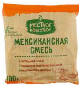
Смесь овощей "Местное Известное" Мексиканская быстрозамор., 400 г