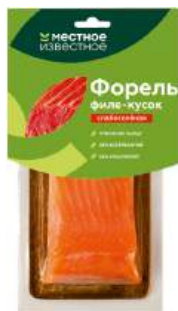
Форель филе-кусочек "Местное Известное" с/с, 150 г