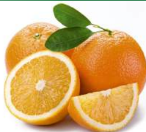
Апельсин, 1 кг Испания