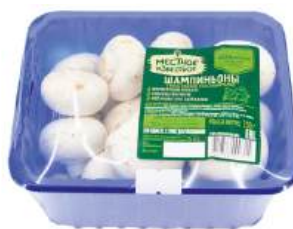
Грибы шампиньоны "Местное Известное", 250г Беларусь