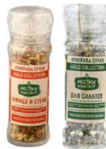
Приправа сухая "Местное известное" Gold Collection Курица и стейк/ Для салатов, 65/80 г