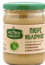
Пюре "Местное Известное" Яблочное, 450 г