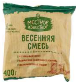
Смесь овощей "Местное Известное" Весенняя быстрозамор, 400 г