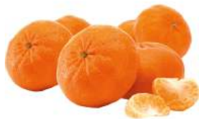
Мандарин Ортакан, 1 кг Испания