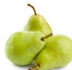
Груша Оксана, 1 кг Нидерланды