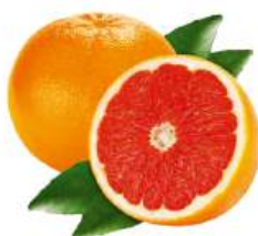
Грейпфрут красный, 1 кг Турция/Египет