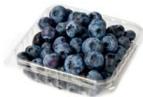
Голубика, 125 г Чили