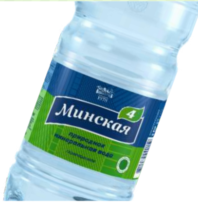
Минеральная вода "Минская- 4", 2 л