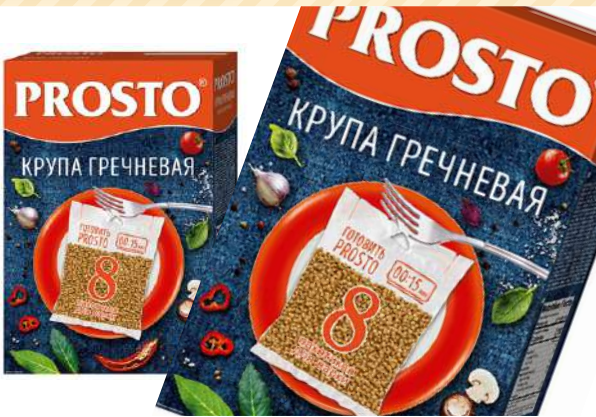
Крупа гречневая "Prosto" в пакетах для варки, 500 г