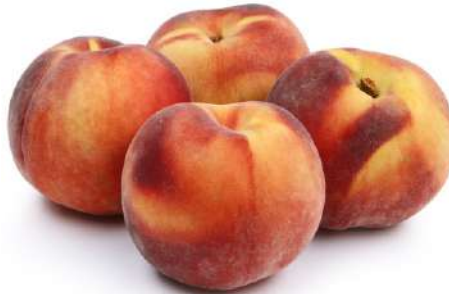
Персик, 1 кг Турция