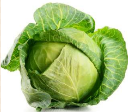
Капуста белокочанная ранняя, 1 кг Россия/Казахстан