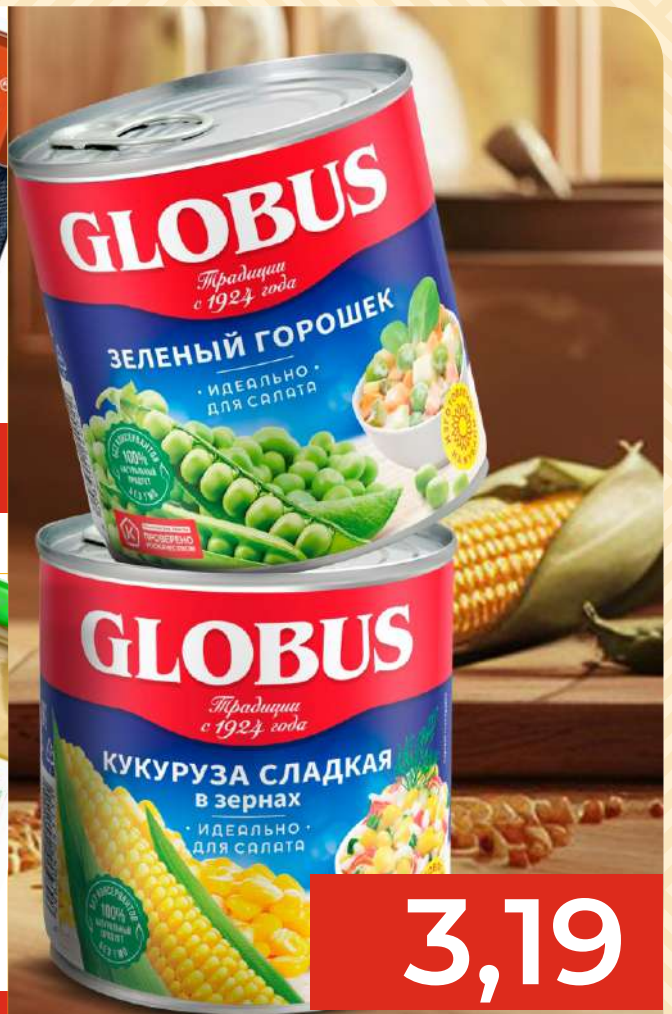
КУКУРУЗА, ГОРОШЕК "GLOBUS", 340/400Г