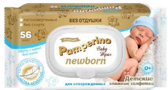
Салфетки влажные "Pampers" Newborn, 56 шт