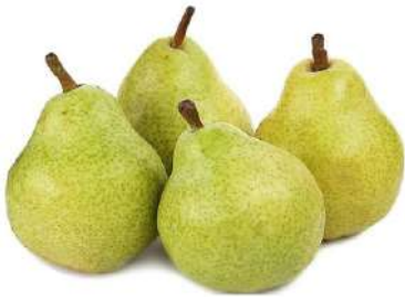
Груша Пакхам, 1 кг ЮАР