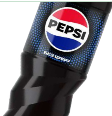
Напиток "Pepsi" в ассорт., 1,5л