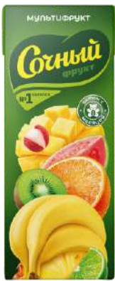
Нектар "Сочный фрукт" для детского питания в ассорт., 200 мл