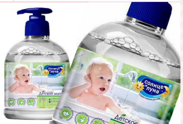
Жидкое мыло "Солнце и Луна" Купание 0+, 500 мл