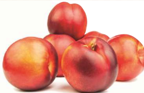
Нектарин, 1 кг Турция