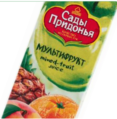
Сок "Сады Придонья" в ассорт., 1 л