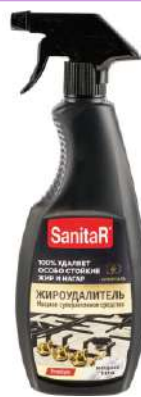
Жирудалитель "SanitaR" спрей UNIVERSAL, 500 мл