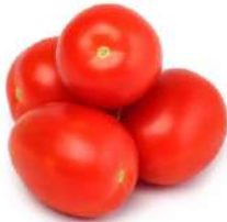
Томат сливка, 1 кг Беларусь