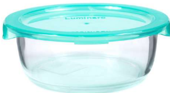
Контейнер стеклянный "Keep n Box Lagon", 420 мл

КРОМЕ GREEN: 7, 9, 10, 19, 21-23, 26-32 (СМ. НА ОБОРОТЕ)