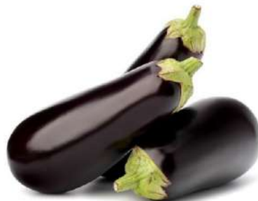
Баклажан, 1 кг Беларусь