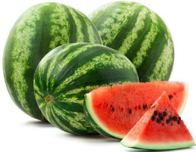
Арбуз, 1 кг Турция