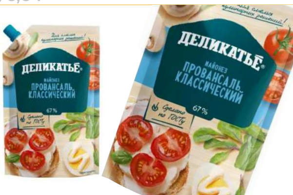
Майонез Деликатье "Классический" 67%, 380 г