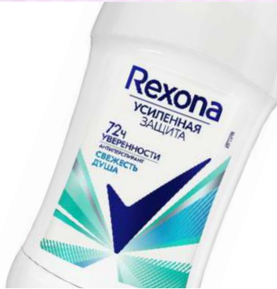
Антиперспирант "Rexona" Свежесть душа, 40 мл