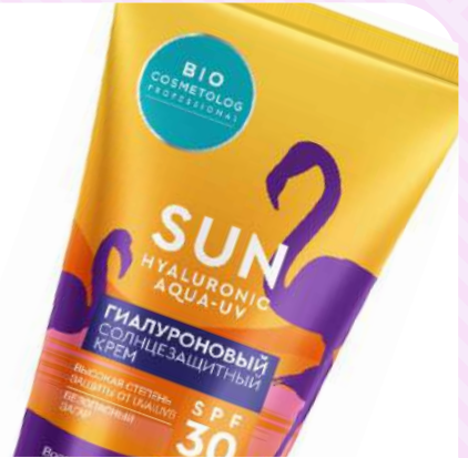
Солнцезащитный крем "BIO COSMETOLOG PROFESSIONAL" SPF 30, 150мл