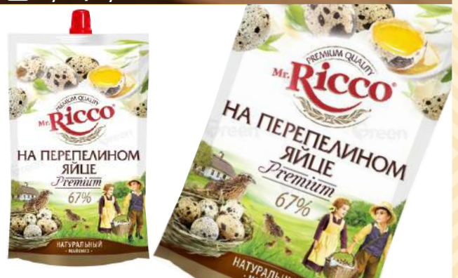
Майонез на перепелином яйце "Mr. Ricco" 67%, 205 г