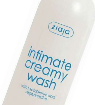
Крем-мыло для интимной гигиены "Ziaja", 500 мл