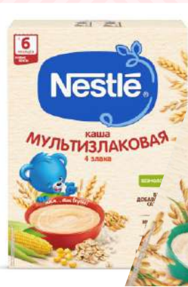
Каша сухая безмолочная "Nestle" в ассорт., 200 г