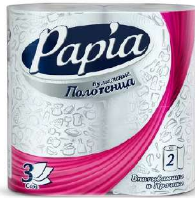
Полотенца бумажные "PAPIA" 3 сл, 2 рул