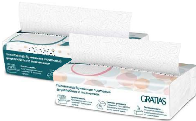
Полотенца бумажные "Gratias", 100 лист