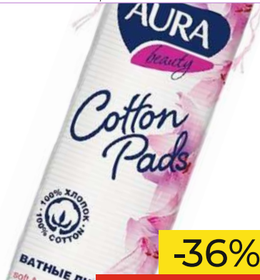
Ватные диски "AURA" beauty, 120 шт