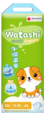
Подгузники "WATASHI" 3/4/5, 52/46/42 шт