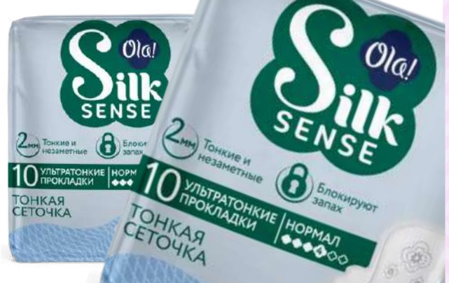
Прокладки гигиенические "Ola!" Silk Sense ULTRA NORMAL, 10 шт