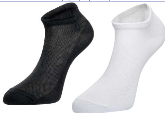
Носки мужские "Chobot" р 25-27, 27-29 в ассорт., 1 пара

КРОМЕ GREEN: 21,22,22-33 (СМ. НА ОБОРОТЕ)