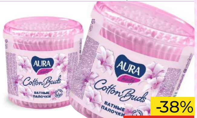
Ватные палочки "AURA", 200 шт