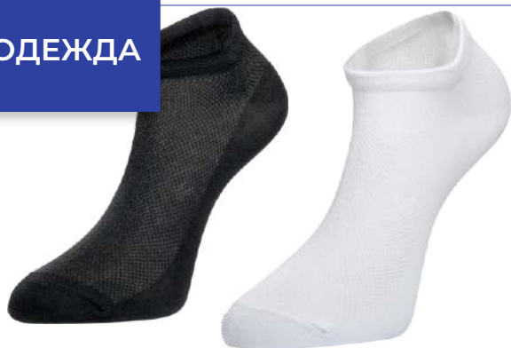
Носки жен "Chobot" в ассорт., р 23,25, 1 пара