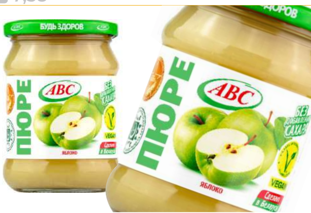
Пюре яблочное "Будь Здоров!", 450 г