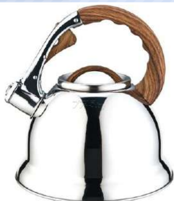
Чайник со свистком "PERFECTO LINEA", 3 л