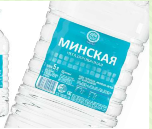
Питьевая вода "Минская", 5 л