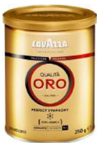
Кофе "Lavazza" молотый Qualita Oro, 250 г