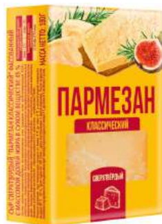
Сыр "DANKЕ" Пармезан сверхтвердый брусок 40%, 180 г