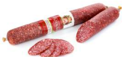
Колбаса "Рублевская" с/в в/с Гродненский МК, 1 кг