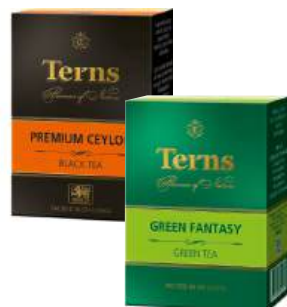
Чай черный/зеленый "Trens" байхов. лист. в ассорт., 100 г