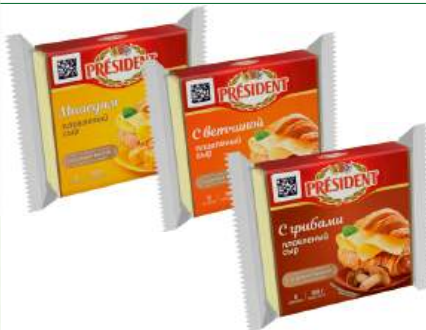
Сыр плавильный "President" 40 % в ассорт., 150 г