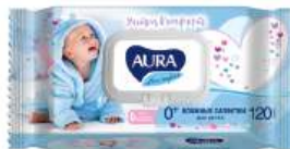
Салфетки детские влажные "Aura" Ultra Comfort алоэ+Е, 120 шт

КРОМЕ GREEN: 4; 28; 29; 31; 35 ЦЕН. НА ОБОРОТЕ