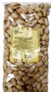
Орехи Фисташковые неочищенные жареные соленые 500 г

28,25 КРОМЕ GREEN: 4,14; 22,25; 28; 28,35 ЦЕН. НА ОБОРОТЕ