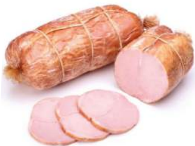
Полендвица "Домашняя" мясн. к/в Брестский МК, 1 кг