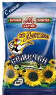
Семечки подсолнечника жареные "ОТ МАТИНА" соленые отборные "Премиум", 100 г