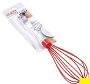
Венчик для взбивания силиконовый с пластмассовой ручкой 28 см (арт. 966233-1, код 210374)

КРОМЕ GREEN: 7,9,10,19,24-35 (СМ. НА ОБОРОТЕ)