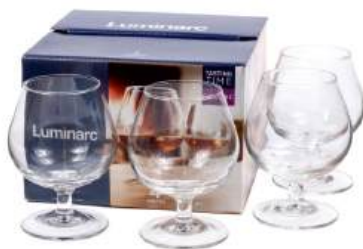
Набор бокалов для коньяка стеклянных "Luminarc" Tasting time. cognac арт. P9243 4 шт, 250 мл

КРОМЕ GREEN: 25, 26, 28-35 (СМ. НА ОБОРОТЕ)