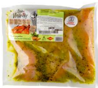
Стейк из мяса индейки "Держи Индейку" с пряными травами в пакете для запек., 1 кг