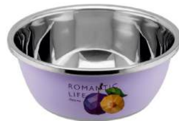
Миска для взбивания "PERFECTO LINEA" Romantic life из нерж. стали диам. 28 см

КРОМЕ GREEN: 7,9,10,19,24-35 (СМ. НА ОБОРОТЕ)