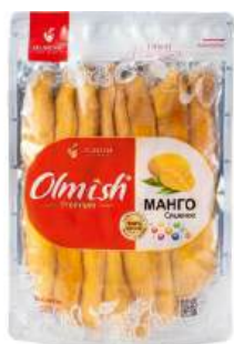
Манго сушеное "Olmish", 500 г