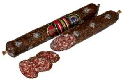
Колбаса "Брауншвейгская" с/к в/с Борисовский МК, 1 кг