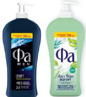
Крем-гель для душа "Fa" в ассорт., 750 мл

КРОМЕ GREEN: 7; 9; 19; 24; 35 ЦЕН. НА ОБОРОТЕ