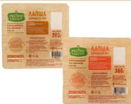
Тесто для домашней лапши "Местное известное" полуфабрикат №3/№8, 360 г