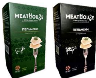
Пельмени "MeatHouse" в ассорт. п/ф замороз., 400 г