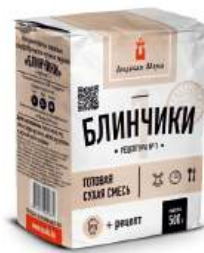
П/ф мучной "Блинчики №1", 500 г