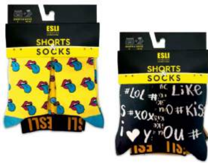
Набор муж. "ESLI" (трусы+носки) в ассорт.

ТОЛЬКО GREEN: 1-5, 9, 11-14, 16, 23 (СМ. НА ОБОРОТЕ)