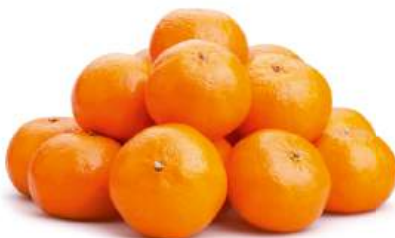
Мандарин, 1 кг Турция