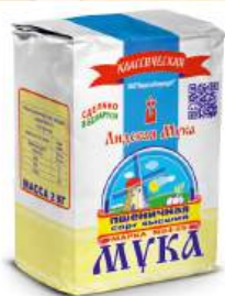
Мука "Лидская Мука" Классика пш. в/с М54-25, 2 кг