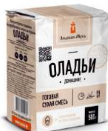
П/ф мучной "Оладьи Домашние", 500 г