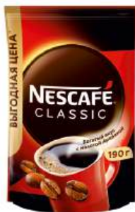
Кофе растворимый "Нескафе" Классик, 190 г