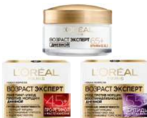
Крем для лица "L'Oréal" Возраст Эксперт в ассорт., 50 мл