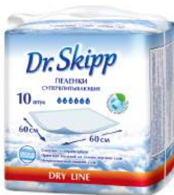
Пеленки детские гигиенические "DrSkipp Dry Line" с суперабсорбентом р-р 60x60 см, 10 шт

КРОМЕ GREEN: 25; 28; 24; 35 ЦЕН. НА ОБОРОТЕ