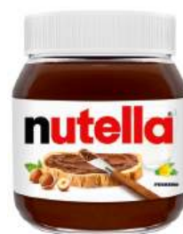
Паста "Nutella", 350 г