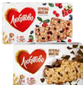
Печенье злаковое "Любитово" Мюсли с клюквой и изюмом/Мюсли с шоколадом, 120 г

62,90 КРОМЕ GREEN: 32,33 ЦЕН. НА ОБОРОТЕ