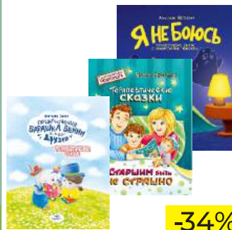
Книга д/детей "Приключения барашка Бенни и его друзей"/"Старшим быть не страшно"/"Я не боюсь."/

КРОМЕ GREEN: 21; 28; 32; 34 ЦЕН. НА ОБОРОТЕ