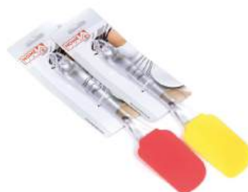
Лопатка кухонная силиконовая с пластмассовой ручкой 25 см (арт. 991080, код 185443)

КРОМЕ GREEN: 7,9,10,19,24-35 (СМ. НА ОБОРОТЕ)