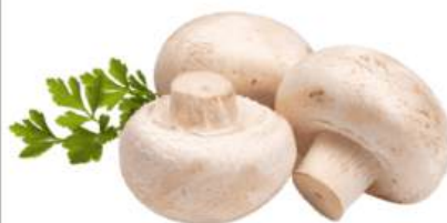
Грибы шампиньоны, 1 кг Беларусь