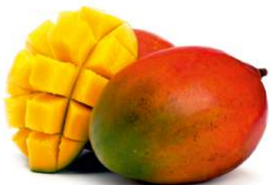
Манго, 1 кг Перу, Бразилия