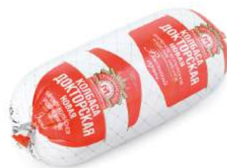
Колбаса "Докторская новая" вар. в/с Гродненский МК, 580 г