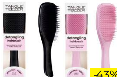
Расческа "Tangle Teezer" The Ultimate (Wet) Detangler Rosebud Pink/ Detangler Midnight Black

КРОМЕ GREEN: 9, 10, 25-35 (СМ. НА ОБОРОТЕ)