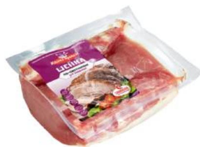
Шейка "По-Охотничьи" для запекания п/ф к/к б/к охл., 1 кг