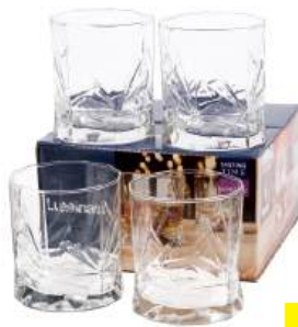
Набор 4-х стаканов 340 мл Время дегустации Виски Рош стекло 10Q4022

КРОМЕ GREEN: 7, 9, 10, 19, 24-35 (СМ. НА ОБОРОТЕ)