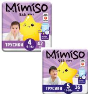
Подгузники-трусики одноразовые "MIMISO" 34/36/42 шт