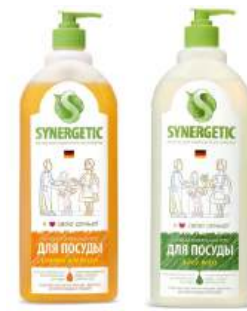
Средство для мытья посуды и кухонного инвентаря детских игрушек, апельсин/алоэ "Synergetic", л

КРОМЕ GREEN: 21; 22; 25; 28; 35 ЦЕН. НА ОБОРОТЕ