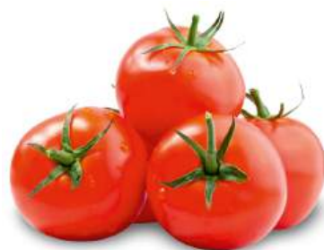
Томат красный 1 кг, Турция