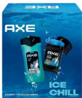
Подарочный набор "AXE" ICE CHILL (део-каранд 50 мл + гель д/душа 250 мл)