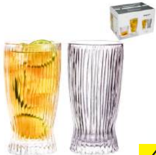
Набор стаканов, 375 мл 1988-174, 6 шт