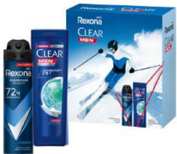
Подарочный набор "REXONA" Абсолютная уверенность (део 150 мл + шампунь-бальзам 200 мл)