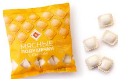
Мясные подушечки с сыром п/ф Брестский МК, 430 г