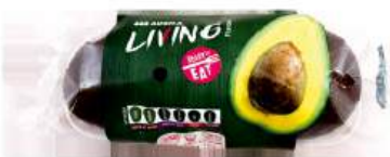
Авокадо HASS фас., 2 шт Испания