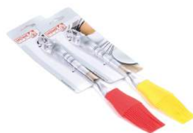
Кисть для теста силиконовая с пластмассовой ручкой 25,5 см (арт. 991081, код 185450)

КРОМЕ GREEN: 7,9,10,19,24-35 (СМ. НА ОБОРОТЕ)