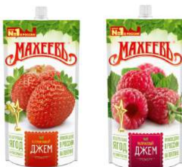
Джем "Махеев" клубнично-малиновый, 300 г