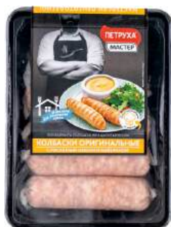
Колбаски "Петруха Мастер" Оригинальные п/ф рубл. из мяса цыпленка-бройлера охл., 600 г