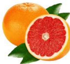
Грейпфрут красный, 1 кг Египет/Испания