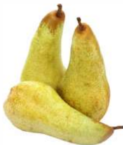
Груша "Аббат", 1 кг ЮАР