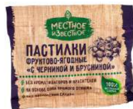
Пастилки фруктово-ягодные "Местное Известное" с черникой и брусникой, 70 г