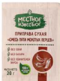
Приправа сухая "Местное Известное" Смесь пяти молотых перцев, 20 г