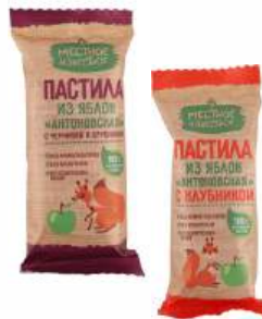
Пастила из яблок "Местное Известное" Антоновская с черникой и брусникой/ с клубникой, 30 г