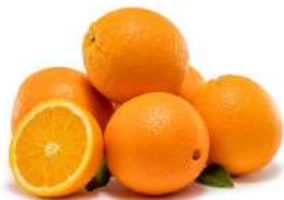
Апельсин, 1 кг Египет