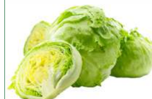
Салат "Айсберг", 1 кг Иран