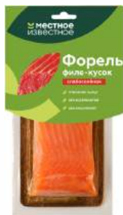
Форель филе-кусочек "Местное Известное", 200 г