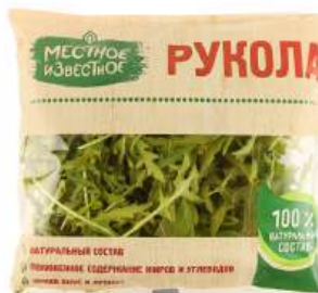
Салат "Местное Известное" Руккола, 60 г