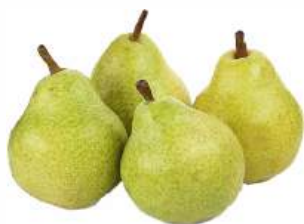
Груша "Пахам", 1 кг ЮАР