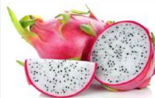
Питahaya, 1 кг Китай