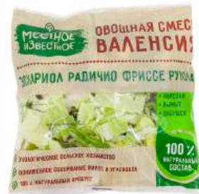
Овощная смесь "Местное Известное" Валенсия, 170 г