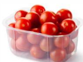
Томат черри, 250 г РФ