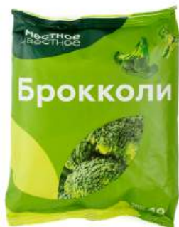
Капуста брокколи "Местное Известное" быстрозамороженная, 400 г