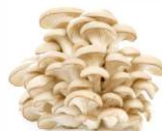
Грибы вешенки, 200 г Беларусь